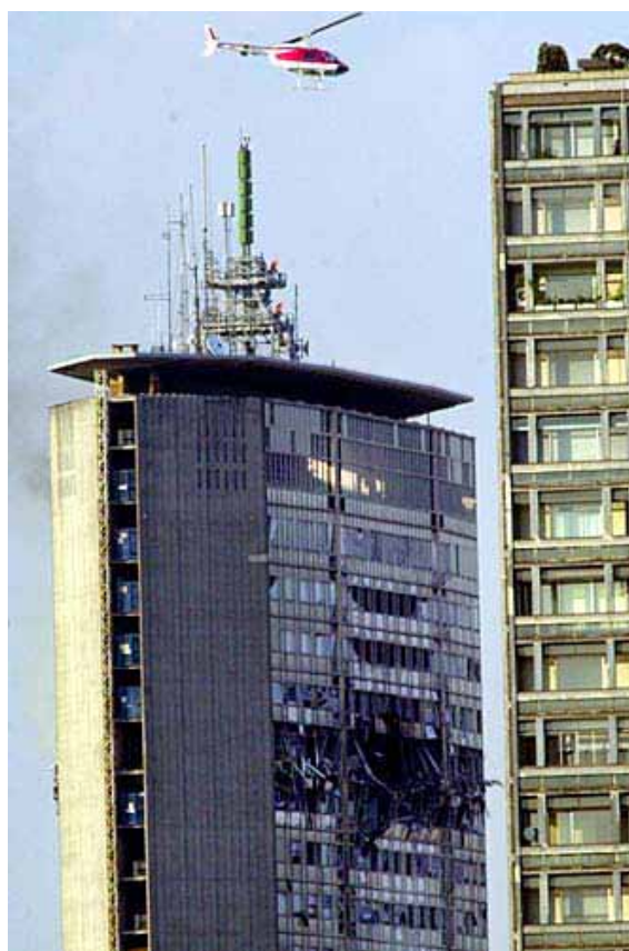
Fig. 2-1 Il grattacielo Pirelli il 18 aprile 2002

Il 18 aprile 2002 un piccolo aereo da turismo si è schiantato contro il grattacielo Pirelli, provocando danni strutturali tra il 26° e il 27° piano (Fig. 2-1). Il piccolo aereo da turismo, un Rockwell Commander 112TC, era partito da Locarno diretto all'aeroporto Linate di Milano, ma, dopo un volo di circa 110 km e una deviazione verso il centro della città, è andato ad impattare contro il Palazzo della Regione Lombardia.