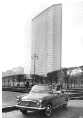
Fig. 2-2 Il grattacielo Pirelli negli Anni '60

Il grattacielo Pirelli [10] è stato costruito tra il 1955 ed il 1959 su progetto dell'architetto Gio Ponti e con la consulenza degli ingegneri Pierluigi Nervi e Arturo Danusso per le strutture in calcestruzzo armato; nato come avveniristica sede direzionale della Pirelli (Fig. 2-2), oggi è la sede principale degli uffici della Giunta Regionale di Lombardia.