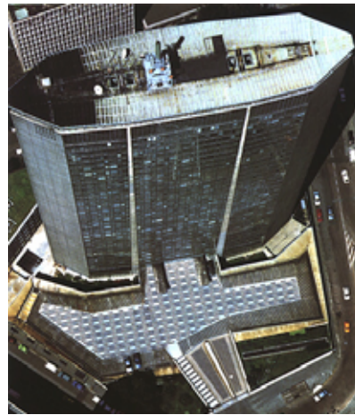
Fig. 2-4 Veduta aerea del grattacielo Pirelli

I più gravi problemi dal punto di vista statico, che furono risolti in fase di progettazione, grazie all'intervento degli ingegneri Nervi e Danusso, furono quelli dell'azione del vento, agente sulle ampie facciate, e delle vibrazioni trasmesse alla struttura in calcestruzzo armato da agenti esterni, problemi che caratterizzano tutti gli edifici più alti. Gli ingegneri decisero di affidare la totalità dei carichi agenti alla struttura portante, suddivisa in quattro pilastri triangolari, posti all'estremità dell'edificio, e in quattro piloni rastremati, che tagliano perpendicolarmente le facciate.