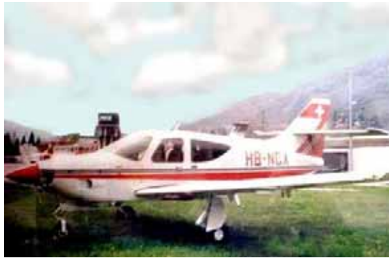
Fig. 2-7 Il Rockwell Commander 112TC

Il Rockwell Commander RC 112TC [13] è un aereo monomotore da turismo di produzione statunitense. Si tratta di un aereo ad ala bassa, con elica bipala a passo variabile, montata su motore a scoppio turbocompresso Lycoming, che sviluppa una potenza di 210 HP e che gli permette una velocità di crociera pari a 300 km/h e un'autonomia massima di 1670 km (Fig. 2-7).