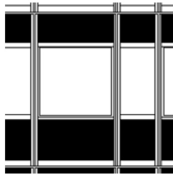
Fig. 2-5 Particolare della facciata

Questo sistema, che si è sviluppato negli USA. sin dagli Anni '50, è denominato facciata continua, o curtain wall [12]. Tale tecnica permise la risoluzione di numerosi problemi, soprattutto di natura statica, che caratterizzavano le facciate in acciaio e vetro, utilizzate precedentemente. La serie di vincoli tra montanti e traverse ha permesso di controllare i movimenti causati dalle escursioni termiche, dal caricamento dei solai e dagli agenti esterni (vento, terremoti, ecc.). Inoltre la costruzione in fabbrica dei pannelli finiti e la loro messa in struttura prefabbricata ha risolto il problema, sia economico che operativo, del montaggio in loco.